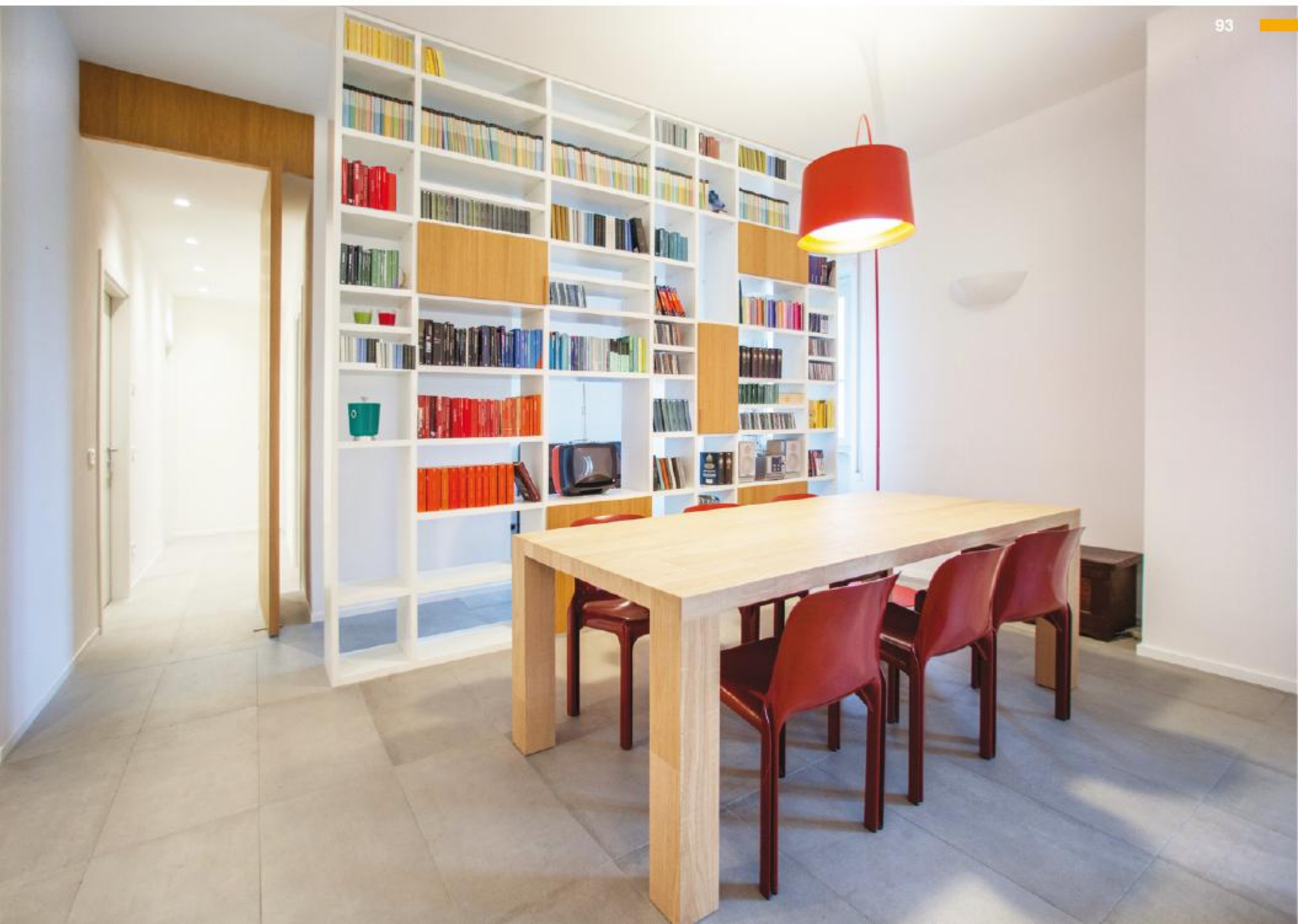
a sinistra/ left : arredo su misura/ tailor-made furniture in basso/ below : sala da pranzo/ dining room