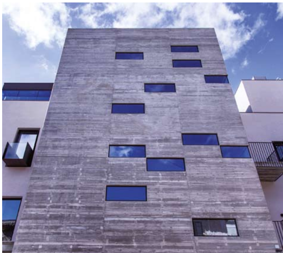
in apertura/ opening page: Vista del prospetto principale/ Main prospect view