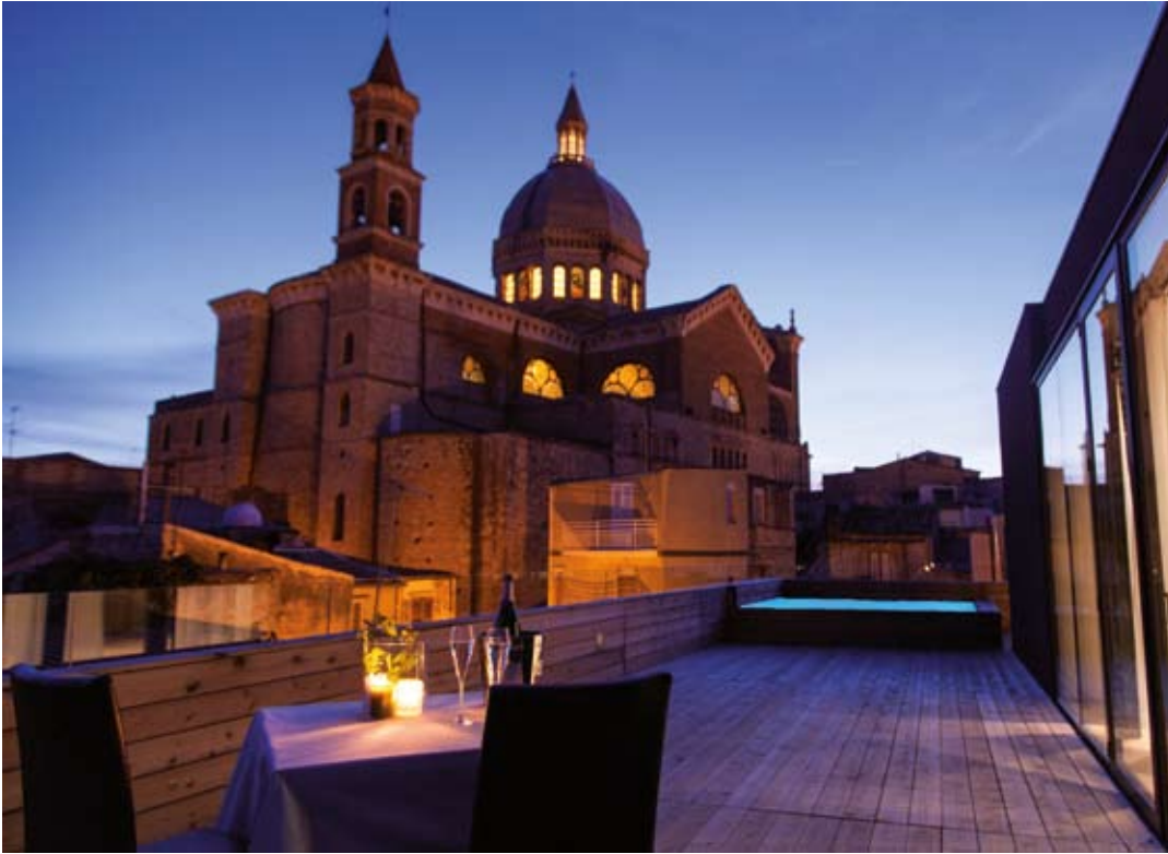
a sinistra/ left: Vista della terrazza di sera/ Terrace view by night