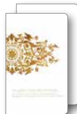
Palazzo Tassoni Estense