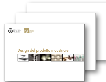
Presentazione Corso di Laurea in Design per Open day