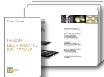
Design del prodotto industriale Presentazione del Corso di Laurea