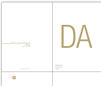
Cartellina porta documenti