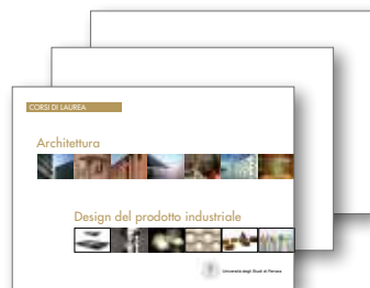
Presentazioni Corsi di Laurea Architettura e Design per Open day