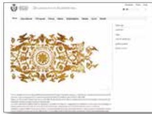
Sito web DA