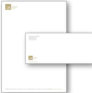
Carta intestata e busta DA