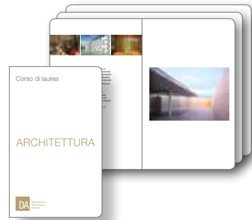
Architettura Presentazione del Corso di Laurea