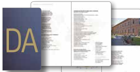
DA Dipartimento di Architettura Presentazione istituzionale versioni in italiano e in inglese