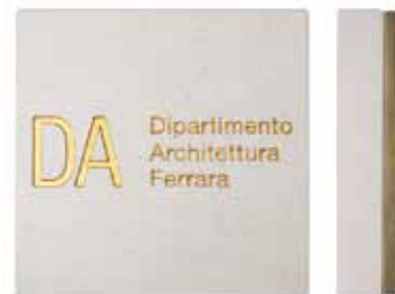
Targa litica DA