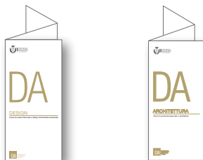
Presentazione (short) Corso di Laurea in Design