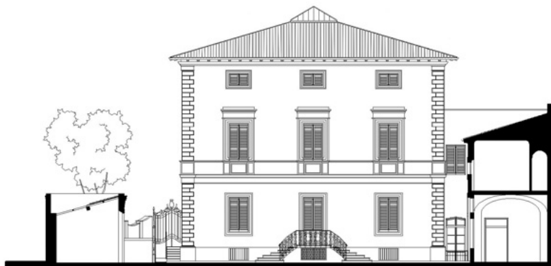
da sinistra a destra/from left to right: Planimetrie piano terra; Planimetria generale; Prospetto principale Villa Raddi / Ground floor plans; General plan; Main elevation Villa Raddi