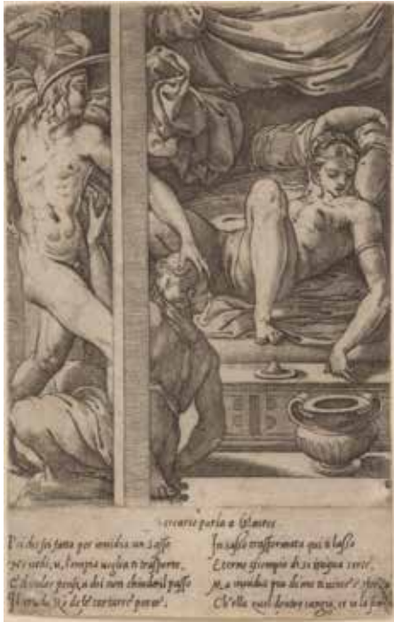
a sinistra/on the left: Anonimo, I Modi, posizione 1, 1878. Stampa di disegno a penna (Waldeck, 1878) / Anonymous, I Modi, position 1, 1878. Pen drawing printing (Waldeck, 1878)